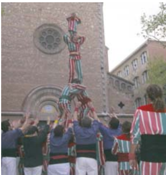
El nostre Pilar saludant al dels Castellers de Gràcia

Dolçaines i tabals al capdavant, muixerangers després apareguérem a la plaça de la Virreina. L'actuació començà junt als castellers de gràcia, fent un pi doble cada colla. Tot seguit preniem el protagonisme de l'acte fent un seguit de figures, torres i balls aplaudits per la gent: la Marieta, el banc, cinc en un peu, la torreta desplegada, la torreta, el ball, la sènia, el pi doble... En acabar, l'anxeneta dels de Gràcia li preguntava al mestre perquè els nostres obrien els braços i no aixecaven els quatre dits en arribar dalt.