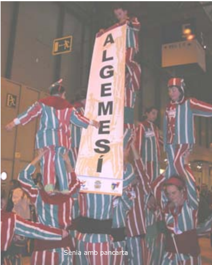
Sènia amb pancarta