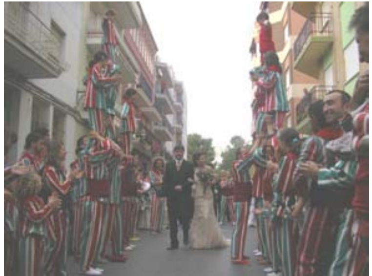
"Pasello" de Cris i Marc entre dos guions