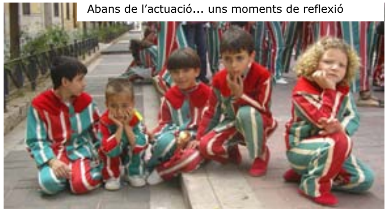
Abans de l'actuació... uns moments de reflexió

La cita era a les 9 del matí d'un diumenge, imagineu-se quina gràcia per a molta gent, fins i tot per a mi. Gent que està acostumada a matinar... però diumenge? En fi, tot anava com una seda, es feia l'hora i els nervis de sempre perquè faltava alguna persona que no apareixia, eh? El viatge en l'autobús va ser un passada, sobretot per als que no anaven dormint. Caldria destacar les estranyes figures que es feien en l'última fila, on les noves generacions muixerangueres ensenyaven als conductors la tradicional figura anomenada Marieta .