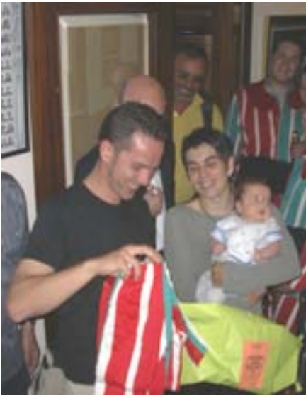
Regal a Pau