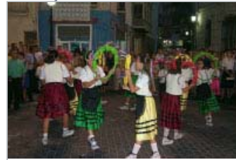
Ball dels Arquets.

[an error occurred while processing this directive]